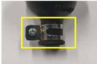
現行品: 金属製バンド