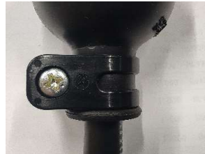
変更品: 樹脂製(サンプル)