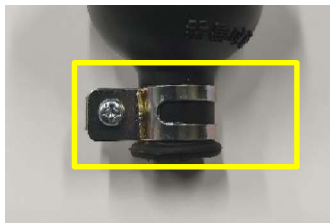
現行品:金属製バンド